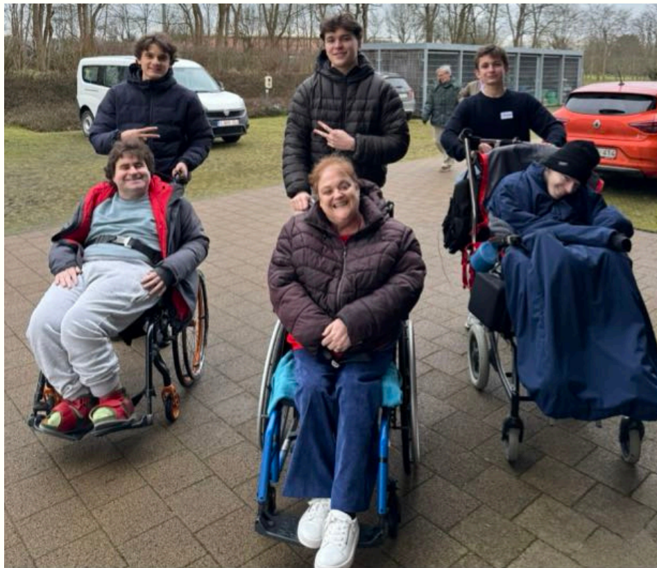
Leerlingen helpen bij Pegode

We vonden het een zeer informatieve dag bij de geefwinkel in Mortsel. Samen met een paar leerlingen en vrouwen hebben we de hele dag spullen gesorteerd en in de loods geplaatst. Elke dinsdag kan iedereen daar gratis 5 artikelen gaan halen, onder andere kleren, speelgoed, lampen en nog veel meer kan opgehaald worden. Als je zelf nog spullen of kleding hebt liggen kun je deze elke dinsdag van 10u tot 15u gaan brengen in de loods in de Neerhoevelaan om mensen in armoede te helpen!